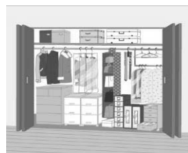
クローゼットへの集中収納