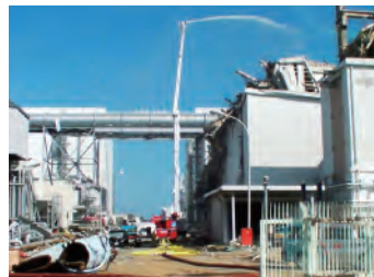
屈折放水塔車による3号機への注水活動 （福島第一原発） Squirt shooting water at the No.3 Reactor (Fukushima No.1 Power Plant)