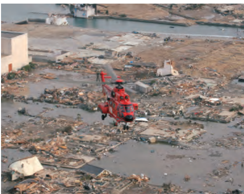
空から救助活動にあたる航空隊 Rescue by the Aviation Unit

派遣部隊数514隊／派遣人員3,243名（平成23年6月6日現在累計） 514 units responded./3,243 members worked.(June 6, 2011)