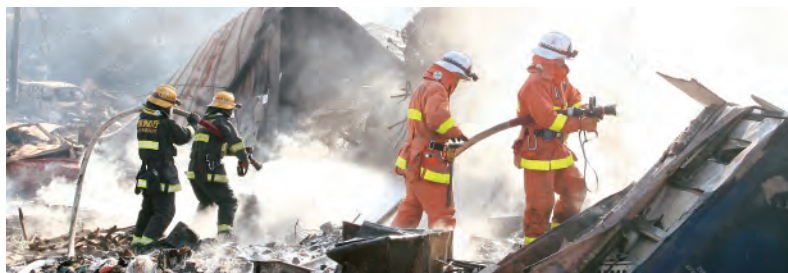
市街地での消火活動（宮城県気仙沼市） Firefighting operations (Kasen-numa City, Miyagi Pref.)