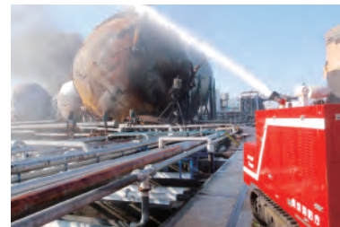
無人走行放水車「ドラゴン」による放水 （千葉県市原市） DRAGON (remote-control water discharger) (Ichihara City, Chiba Pref.)