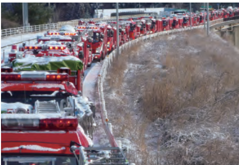
被災地へ向かう緊急消防援助隊 The Emergency Fire Response Team on its way to the disaster scene