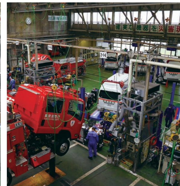
▲整備工場内の様子