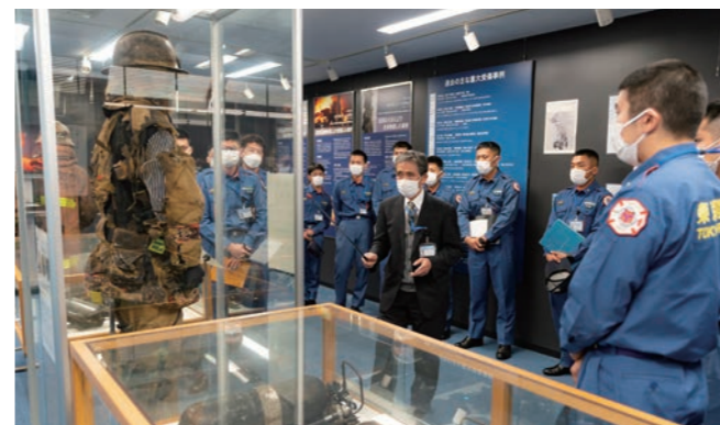
▲過去の災害や事例からの教訓を学ぶ職員

また、科学的見地に立った各種研究や、火災原因の鑑定等を行い、都民生活の安全確保や消防活動時の安全性の向上にも取り組んでいます。