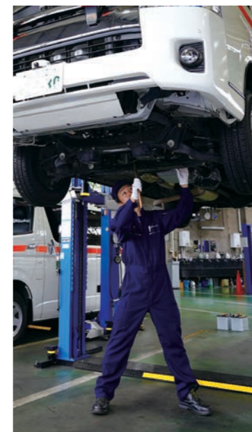
▲救急車を整備中の整備士