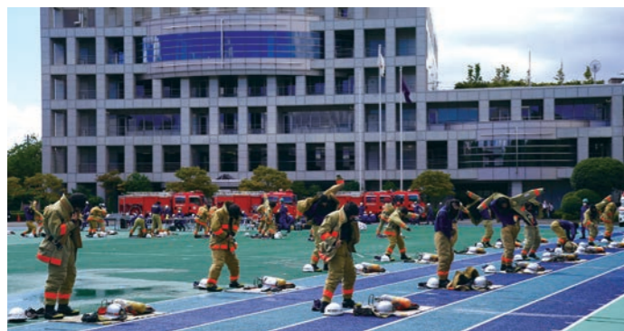
▲初任教育で着装訓練を行う消防学生

新しく採用された消防職員の初任教育、特別救助隊員や救急救命士等の養成をはじめとした専門的な技術を習得する専科教育、管理監督者として必要な能力を身につける幹部教育などを行っています。また、地域防災の要となる消防団員の教育訓練等も行っています。