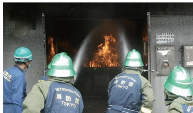
▲消防団員の専科教育