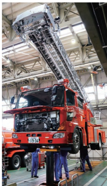
▲整備中のはしご車

また、災害現場等において消防車両等にトラブルが発生した場合は、現場へ急行し、緊急整備を行えるよう24時間体制で消防隊をサポートしています。