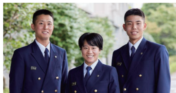
▲消防学校の初任学生