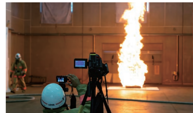
▲南多摩総合防災施設での燃焼実験