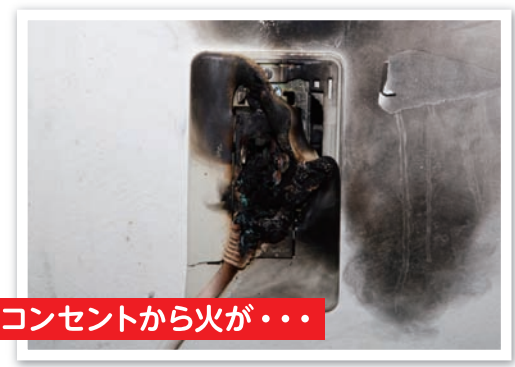
コンセントから火が...