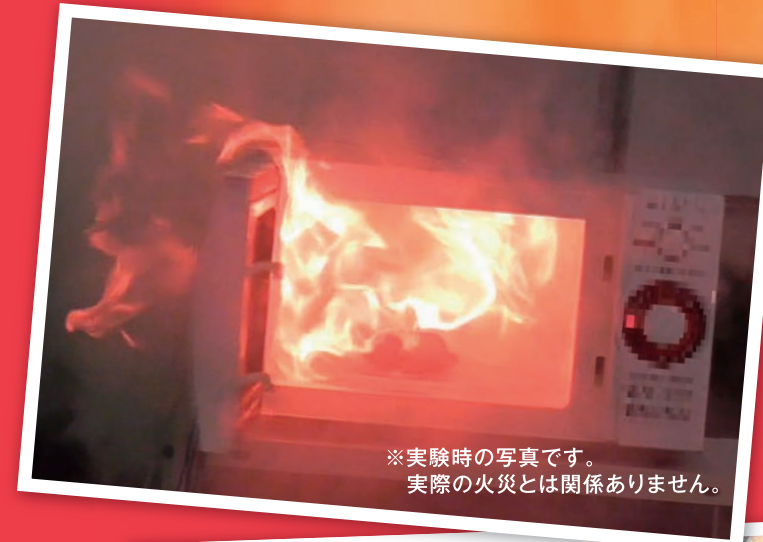
※実験時の写真です。 実際の火災とは関係ありません。