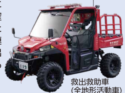
救出救助車 (全地形活動車)

近年頻発する広域自然災害において、特殊車両やエアポートによる泥濘地や浸水地域等への進入、ドローン等による災害状況の確認・把握を行うとともに、他隊と連携した迅速な救出活動を任務とする新しい部隊です。