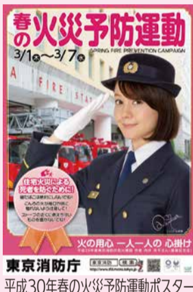
東京消防庁 平成30年春の火災予防運動ポスター

各消防署でも、火災予防運動期間中に様々なイベントを開催します。詳細は各消防署にお問い合わせください。