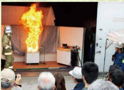
前回の一般公開の様子

※詳細は3月中旬に消防技術安全所ホームページに掲載します。[ http://www.tfd.metro.tokyo.jp/hp-gijyutuka ]