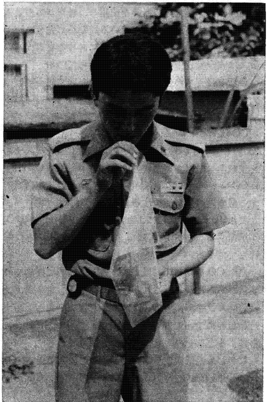
写真2 呼吸採取要領