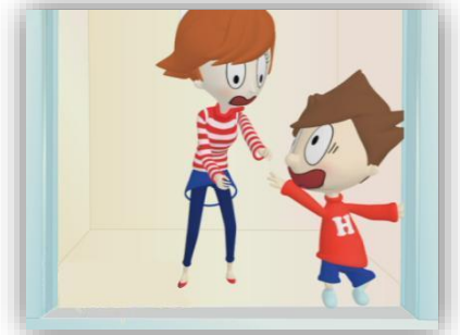
② エレベーターの扉