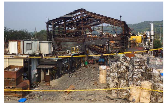
写真② アルミ工場の火災事故の状況

流入した水が、高温のアルミに触れ、 水蒸気爆発を発生 させ、火災になったと推定されます。(写真②参照)