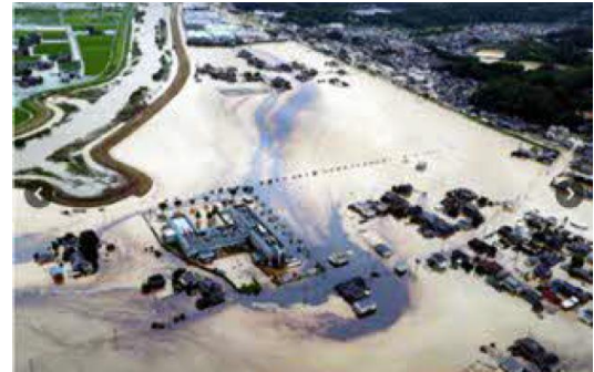
写真① 鉄工所の油流出事故の状況