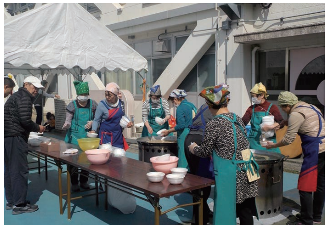
地域防災協議会合同の炊き出し訓練