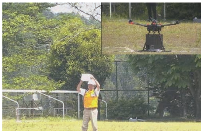
ドローンを活用した救援物資の輸送訓練