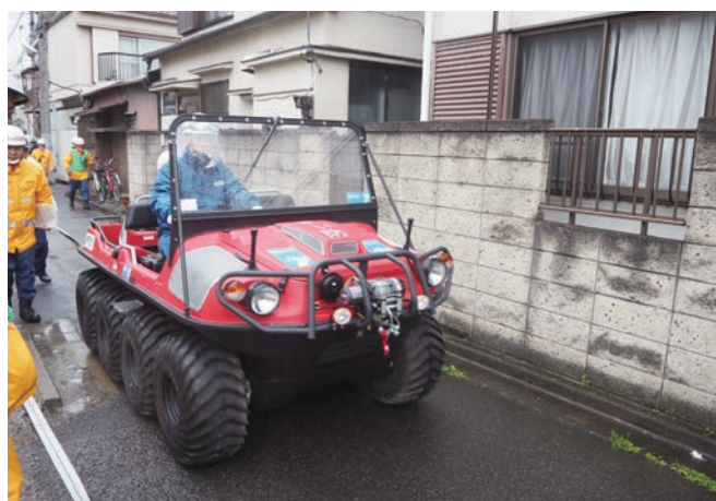
水陸両用バギーによるホース延長

また、隣接会場では総合防災訓練を実施し、雨天にもかかわらず親子連れ等、約1,000名の訓練参加者が集まった。