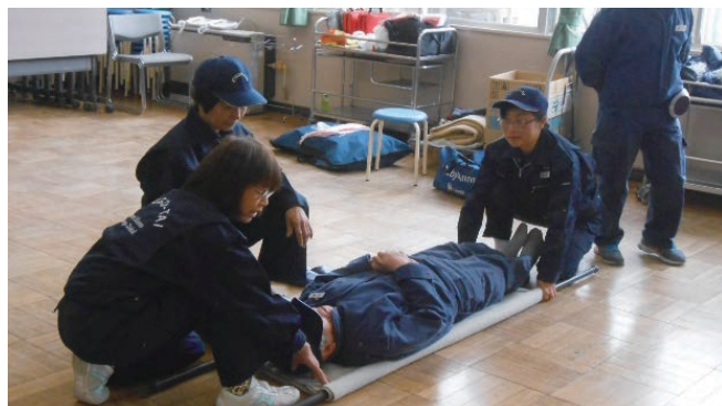
避難所運営開設訓練指導