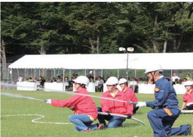
ファイヤーレディースの放水訓練