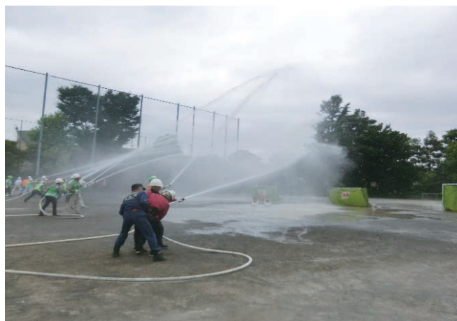
地区合同訓練（D級ポンプ訓練）