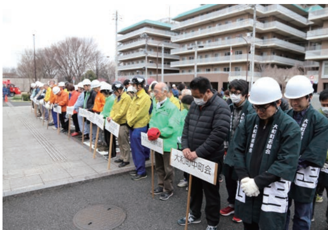
開会式の様子（震災犠牲者への黙とう）

大会に向けての事前訓練を奨励し、地域のニーズにあわせた訓練指導を消防署に依頼したところ、全チームが積極的に訓練を実施しました。また、老若男女問わず幅広い年代でのチーム構成を促し、町会・自治会内でのよこのつながりの強化を図りました。