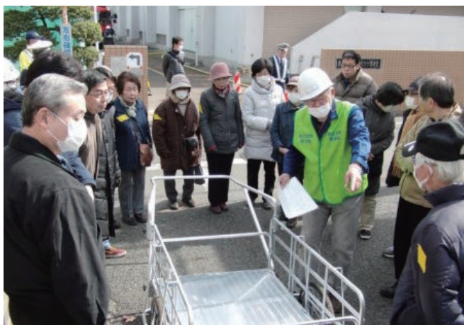
近隣自治会の助け合い避難訓練

休日夜間等に地震が発生した場合、立川ろう学校は無人的となるため、校庭を近隣住民の避難場所として活用できるよう立川ろう学校と事前に取り決めるとともに、校庭の開門の鍵を自治会に預けて管理している。