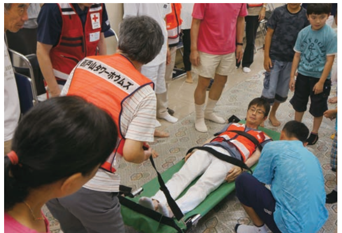
敷地内での傷病者搬送訓練