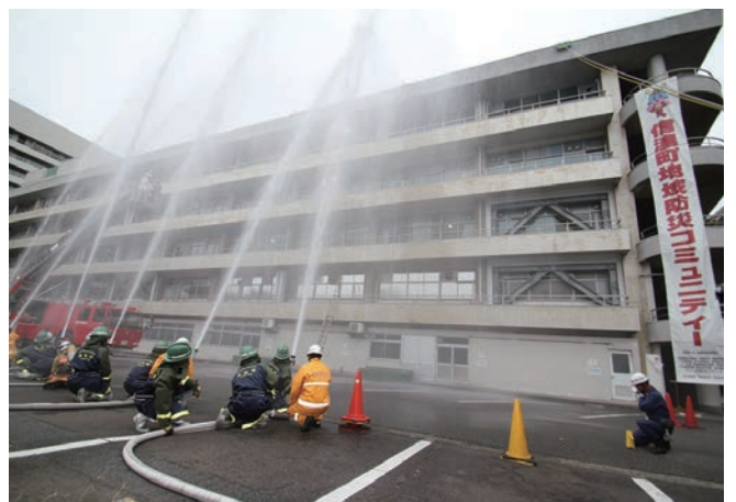
消防隊、消防団、災害時支援ボランティア、参加隊による一斉放水