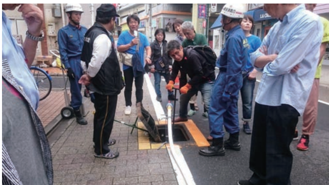
合同防災訓練（初期消火）

従来の広報媒体に加え、HP・SNS発信にも力を入れている。月1回発行の「防犯防災だより」「町会だより」の他、SNS（フェイスブック、ツイッター）でその日に行われた訓練やイベントの様子を写真を交え発信し、より現場に近い雰囲気伝えて参加しやすい環境作りを心掛け、参加者の裾野を広げることを目指している。