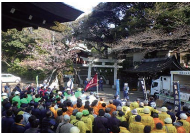
神社に六自治会集結

大田区国際交流担当課の協力のもと、米国、英国、中国、ベトナムの4か国のおおた大使等4名が防火防災訓練に参加し、区広報紙やホームページから英語、中国語、韓国語、タガログ語、ネパール語の5か国語で、外国人が防火防災訓練に参加することの重要性を訴えた。