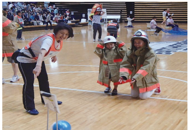
ぼくもわたしも消防士（消火）