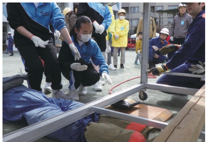
集合防災訓練（防災資機材取扱い訓練）

連合町会防災訓練以外でも、各町会ともに自主防災意識が高く、年末年始の夜間警戒、文化財防火デーにおける住吉神社での古井戸を活用したバケツリレー、消防団及び町会・自治会合同ポンプ操法大会への参加など地域住民が積極的に自助・共助に取り組む活動を実施しています。また、佃三丁目町会は、高齢者のための複合型介護施設『相生の里』と災害時応援協定を結んでおり、有事の際に地域で協力する体制が構築されています。