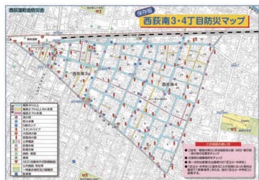
独自の防災マップ