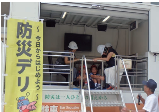
身体防護訓練（起震車体験）

また、将来の地域防災の担い手になりうる中学生や高校生も、学校帰りに訓練に参加するなど、日中の地域防災の要として期待される中・高校生世代の防災行動力の向上にもつなげることができました。