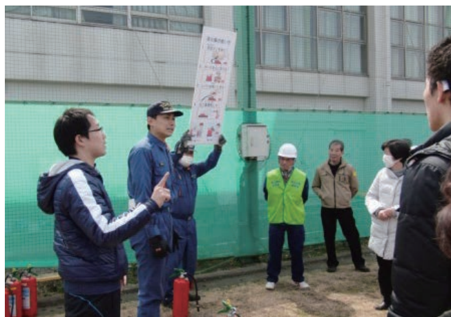
手話による訓練指導