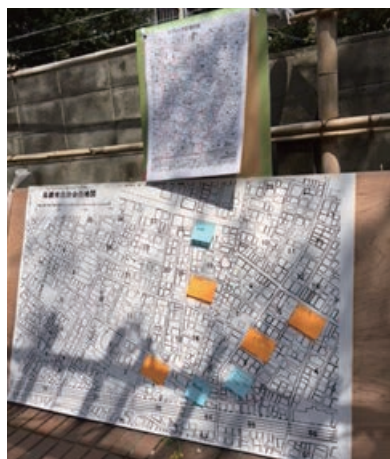
被害調査・安否確認チェック板

日中と夜間では、住民の年齢層なども変わり、参加した住民同士が新しい関係を築くことが出来、更なる防災行動力の強化に繋がることが期待できました。また、避難経路の見え方や所要時間が変わる事の確認をしています。自治会住民を安全に避難場所へ誘導する際の検討事項が確認できました。