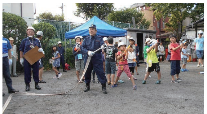
防災訓練参加者の掘り起し