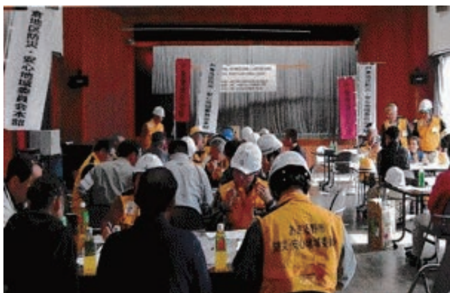
土砂災害を想定した机上訓練