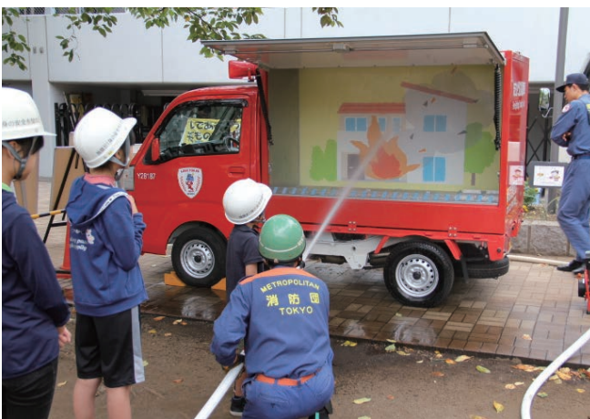
まちかど防災訓練車による消火訓練

5 町会連合会は、毎年、和泉公園において、地域コミュニティの活性化事業として納涼大会を開催し、積極的に付近住民や三井記念病院職員とのコミュニケーションを図っています。