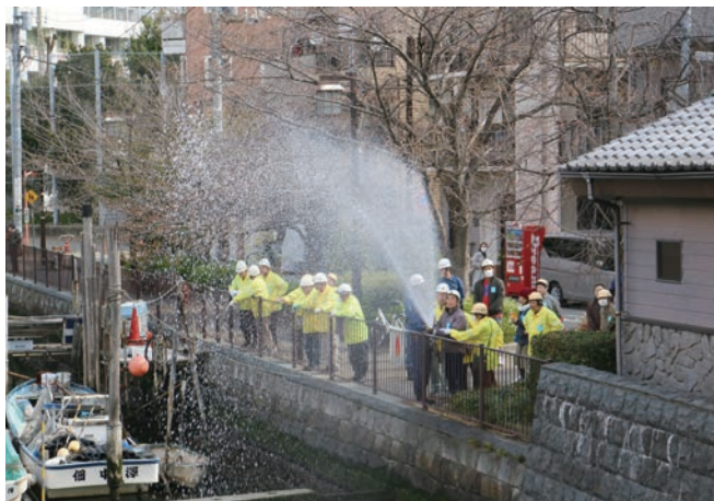
まちかど防災訓練（スタンドパイプ消火訓練）

各町会の防災資機材格納庫から資機材を搬送、安否確認後に、一時集合場所（佃中学校）へ移動（避難訓練）し、途上で火災を発見し、模擬消火器による初期消火及びスタンドパイプを活用した消火訓練を実施。さらに倒れている人を発見し、三角巾等による応急手当を実施後、担架により傷者（ダミー）を佃中学校まで搬送した。