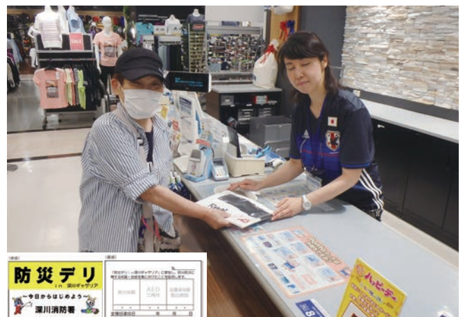
協賛店舗で特典受領（左下：スタンプカード）