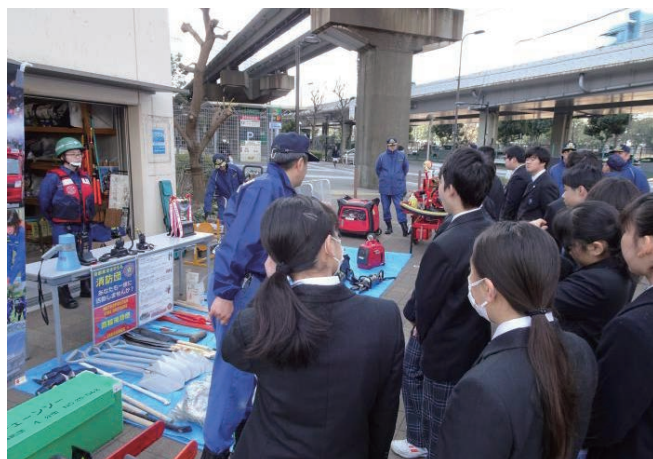
防災まち歩きによる施設見学