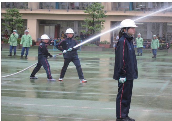
ミニポンプ隊によるD級ポンプ操法

品川区では、2008年から各中学校にD級ポンプの配備を始めました。日野学園では、ミニポンプ隊を7・8・9学年ごとに自主的に編成して、D級ポンプ操法訓練を実施しています。ミニポンプ隊は、品川消防署員及び品川消防団員の訓練指導を受けながら、規律ある行動はもとより迅速的確なポンプ操法の習得に努め、地域の防災訓練等でその成果を披露しています。