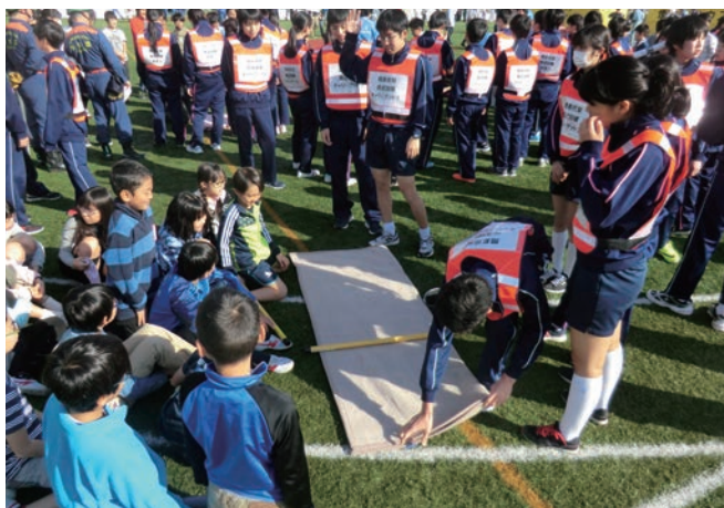
地域住民及び後輩に対する応急担架指導

4 平成29年2月に、1年生を対象に防災まち歩きと称して、高輪消防署、高輪消防団、港区、町会・自治会等と連携し、当該地区にある各種防災関係施設を歩いて回り、当該施設を見学して説明を受け、レポートを作成し、学習に励んでいる。