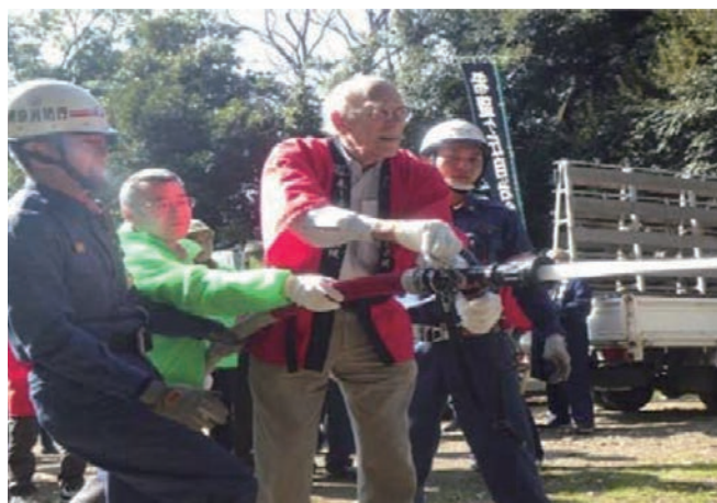
外国人による放水体験