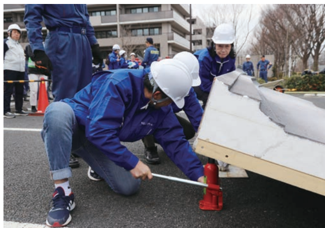
ジャッキを活用した救出訓練