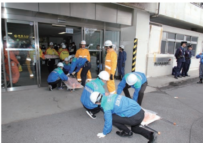
応援に到着した隊による担架搬送活動