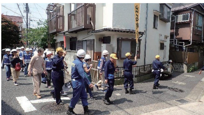
避難行動マニュアルによる訓練

自分達の町を防災目線で歩き、防災マップに街頭消火器、AEDなどの防災資源と長い袋小路、老朽化した万年堀などの危険個所をまとめた。平成27年3月に防災マップを活用し、車いすやリヤカーでの避難訓練を実施し、要配慮者目線でチェックした。