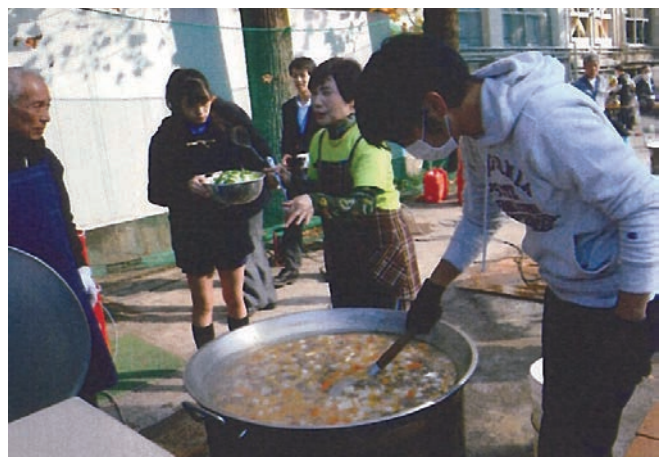
参加者による炊出し訓練