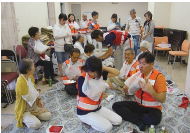
住民同士で応急救護

消防活動審査会、救急活動審査会、消防団操法大会等の見学をすることで、消防活動への理解を深め、防災意識の向上を図っている。