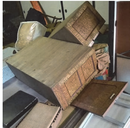
北海道胆振東部地震の室内被害(安平町 震度6強)