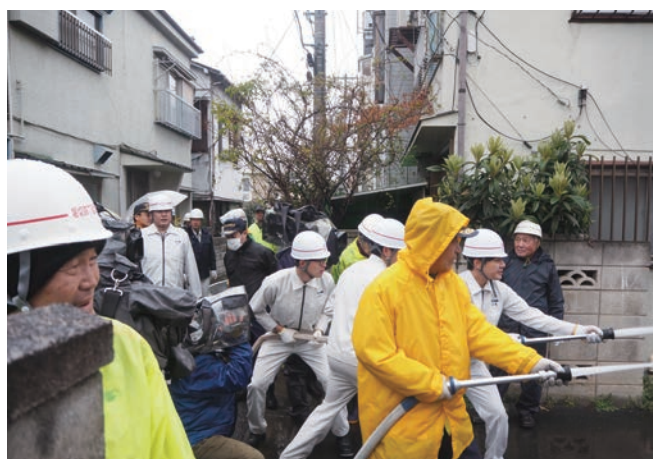
市民消防隊と自衛消防隊による放水