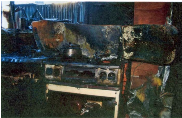
写真 1 出火したガステーブルの状況