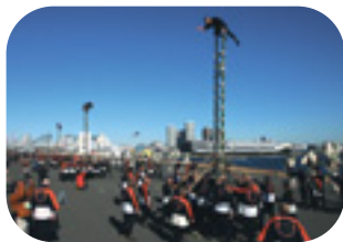
木遣り行進・はしごのり演技