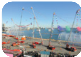
一斉放水・はしご隊演技