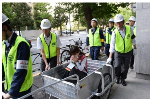
災害時医療連携訓練