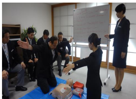
英語での応急救護訓練

また、英語と中国語による応急救護訓練を計画的に実施され、近年増加している外国人旅行者にも安心して宿泊できるホテルを提供するための努力が続けられています。