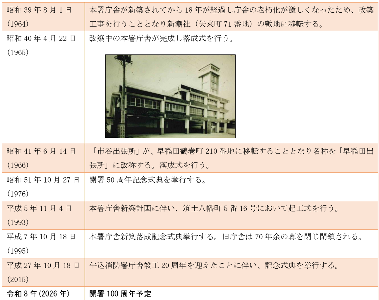
現在の牛込消防署本署