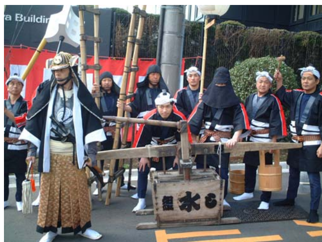
定火消標柱建立を記念しての演習の様子