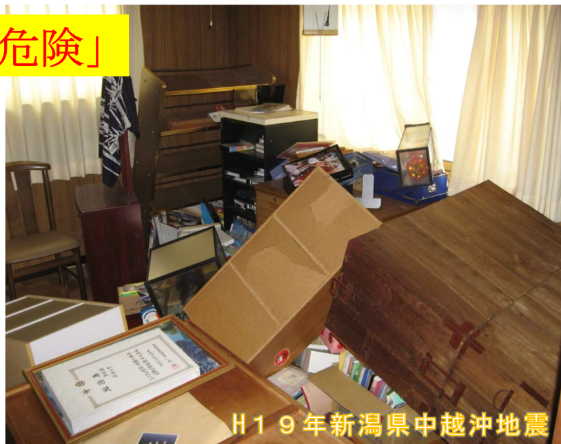
H19年新潟県中越沖地震

★家具に固定金具を付けたり、レイアウト や収納を工夫するなどして危険を未然に防 ぎましょう。