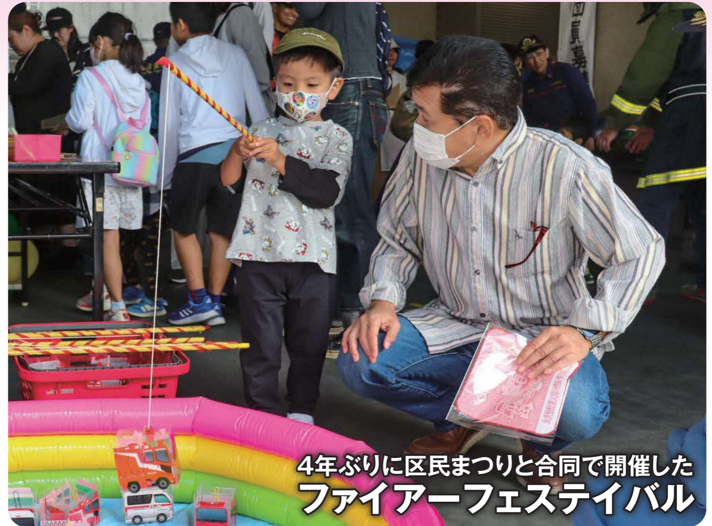
4年ぶりに区民まつりと合同で開催した ファイアーフェスティバル

滝野川消防署シンボルマーク 放水のアーチと滝野川消防署の頭文字のTと 鷹口を図案化したものです