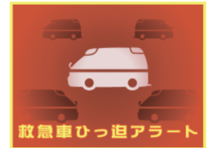
救急車ひっ迫アラートロゴ

『救急車ひっ迫アラート』発表時のように、救急出場が増加した際は、現場から遠い救急車が駆け付けられることが増え、救急車の到着が遅れる恐れがあります。いつも以上に、体調管理に注意をお願いします。