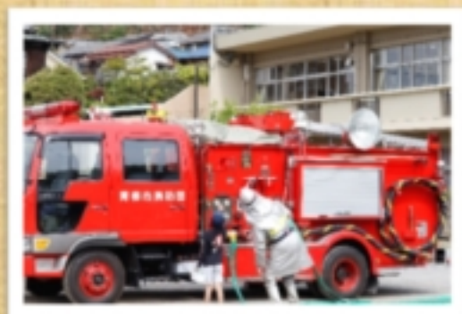
【第一小 写生会風景】