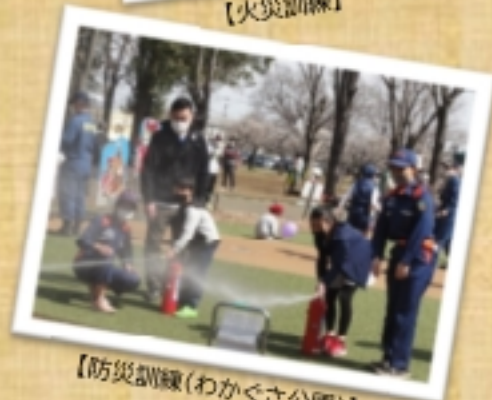
【防災訓練(わかぐさ公園)】