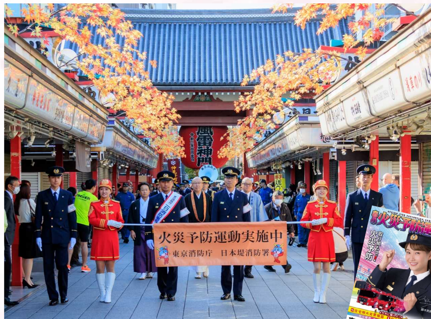
令和5年秋の火災予防運動 IN 浅草寺の様子