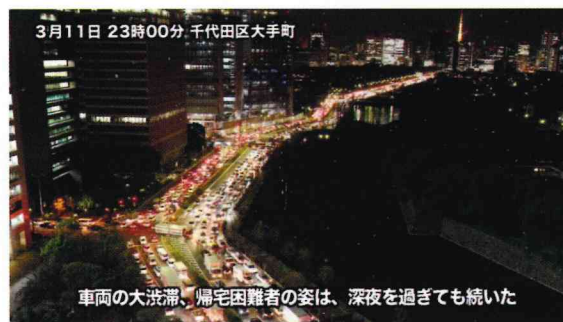
車両の大渋滞、帰宅困難者の姿は、深夜を過ぎても続いた