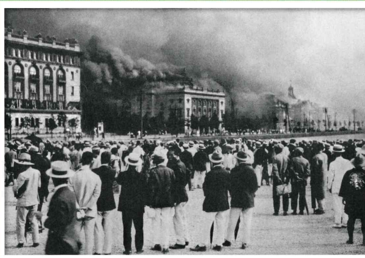
関東大震災発生時、丸の内消防署管内被害状況