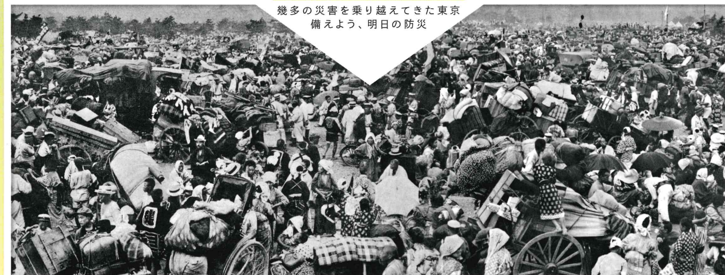
関東大震災発生時の丸の内消防署管内、広場に集まる避難群衆（皇居外苑）