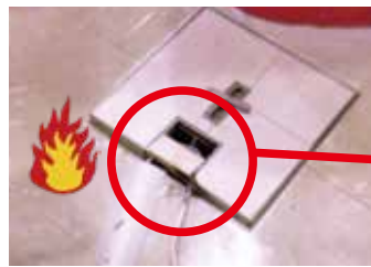
床用コンセントから出火

床用コンセントに接続されていたテーブルタップの電源コードを床用コンセントの蓋で損傷させ、短絡、周囲の合成樹脂に着火し、出火したものです。