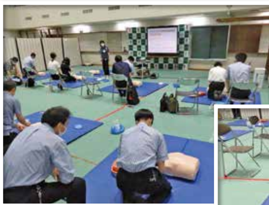
コロナ禍での救命講習の様子