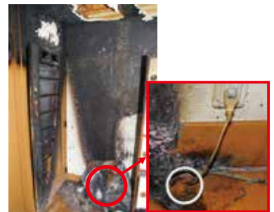
コードから出火した火災