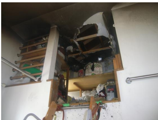
写真 2-1 ロフトの焼損状況