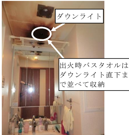
写真3-1 洗面所の焼損状況