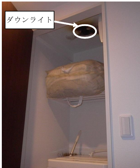
写真 1-1 洗濯機置場の焼損状況