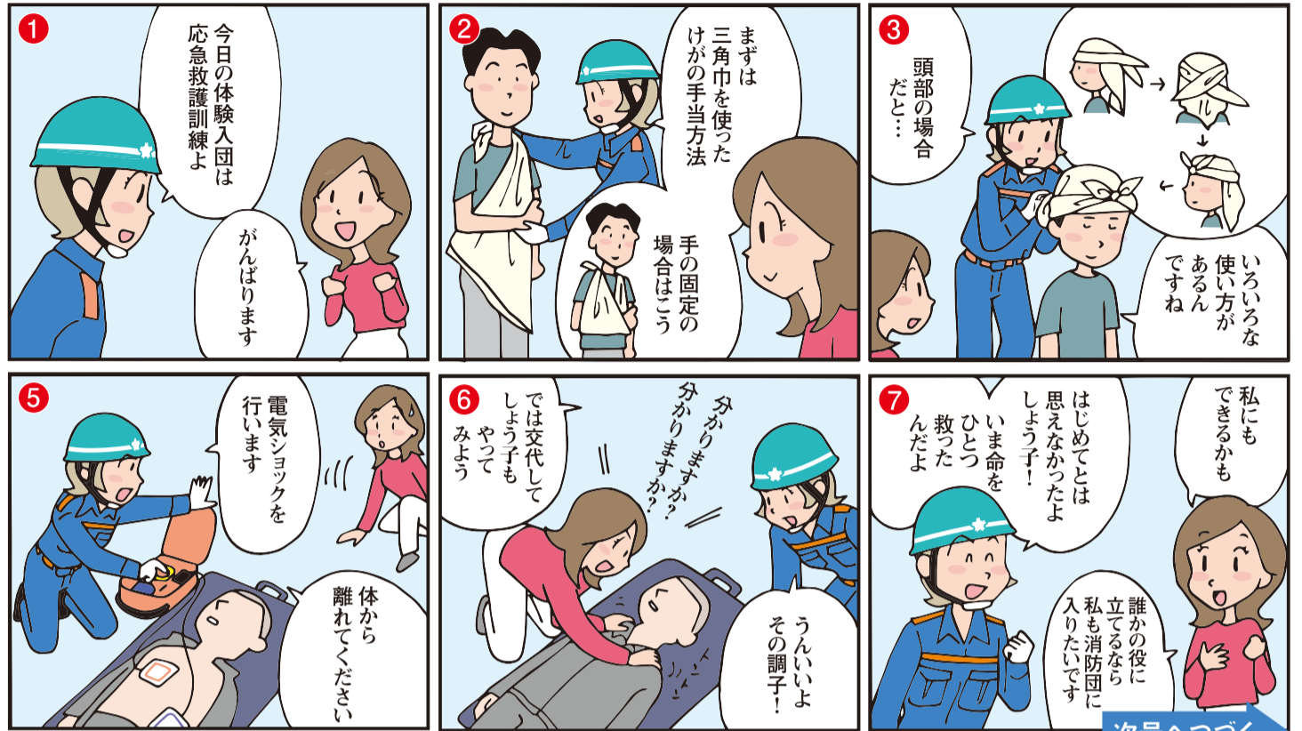
※AED=自動体外式除細動器