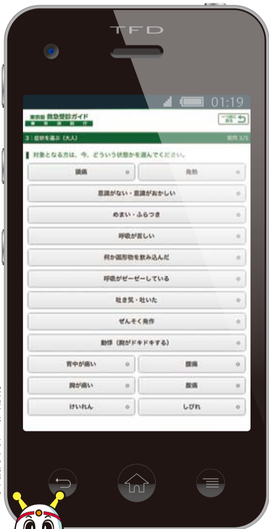
※写真はスマートフォン版です。