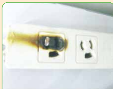
テーブルトップの焦げ跡