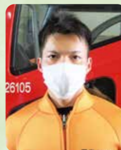
番組内で取り上げられた新人水難救助隊員