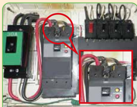
ブレーカーの焦げ跡

令和2年中、東京消防庁管内では電気火災が1,163件発生しました。そのうち、電線が短絡・ショートして出火する火災が309件と多く発生しています。