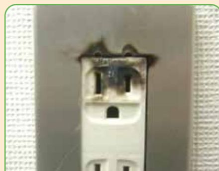
コンセントの焦げ跡