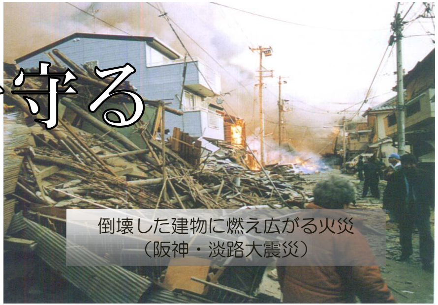
倒壊した建物に燃え広がる火災 (阪神・淡路大震災)