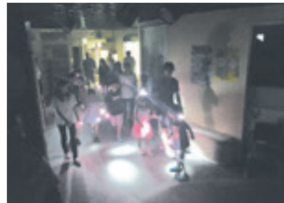
▲ ナイトツアー体験の様子