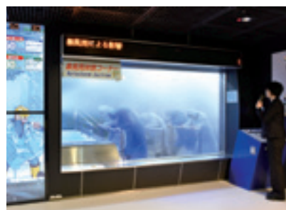
▲ 暴風雨体験コーナー体験の様子

また、画面上部には体験室内の「雨量」「風速」が表示されるため、体験室内の状況がより理解しやすくなっています。