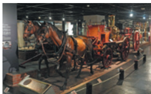
▲ 馬牽き蒸気ポンプ