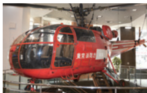
▲ 消防ヘリコプター