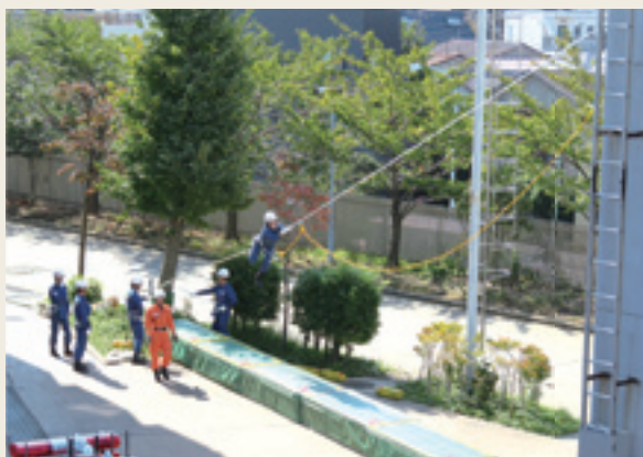
▲ 特別救助技術研修