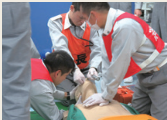
▲ 救急救命士就業前研修