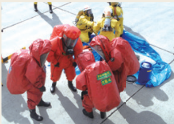
▲ 化学災害技術研修