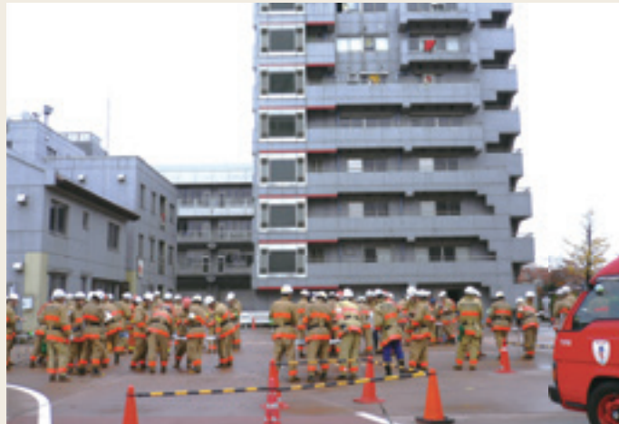
▲ 中級幹部研修(高層ビル火災指揮訓練)

幹部職員としての業務管理能力や消防部隊の指揮・統率力の向上など、その階級職に応じた必要な能力の伸長を図ることを目的として実施しています。(図表2-8-2、3)