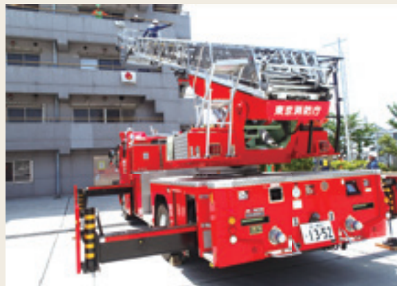
▲ 特別操作機関技術研修