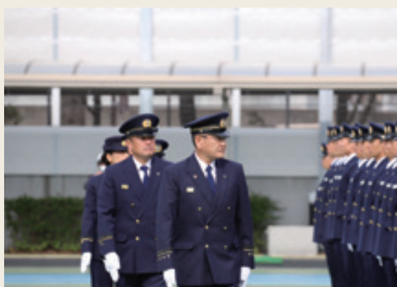
▲ 人員、姿勢、服装等の点検