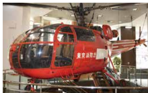
▲ 消防ヘリコプター