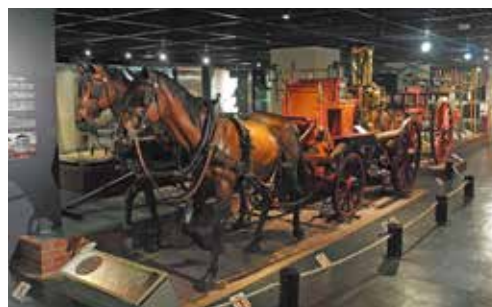
▲ 馬牽き蒸気ポンプ