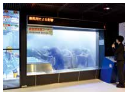
▲ 暴風雨体験コーナー体験の様子

また、画面上部には体験室内の「雨量」「風速」が表示されるため、体験室内の状況がより理解しやすくなっています。