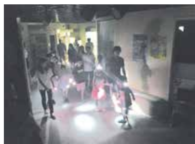
▲ ナイトツアー体験の様子