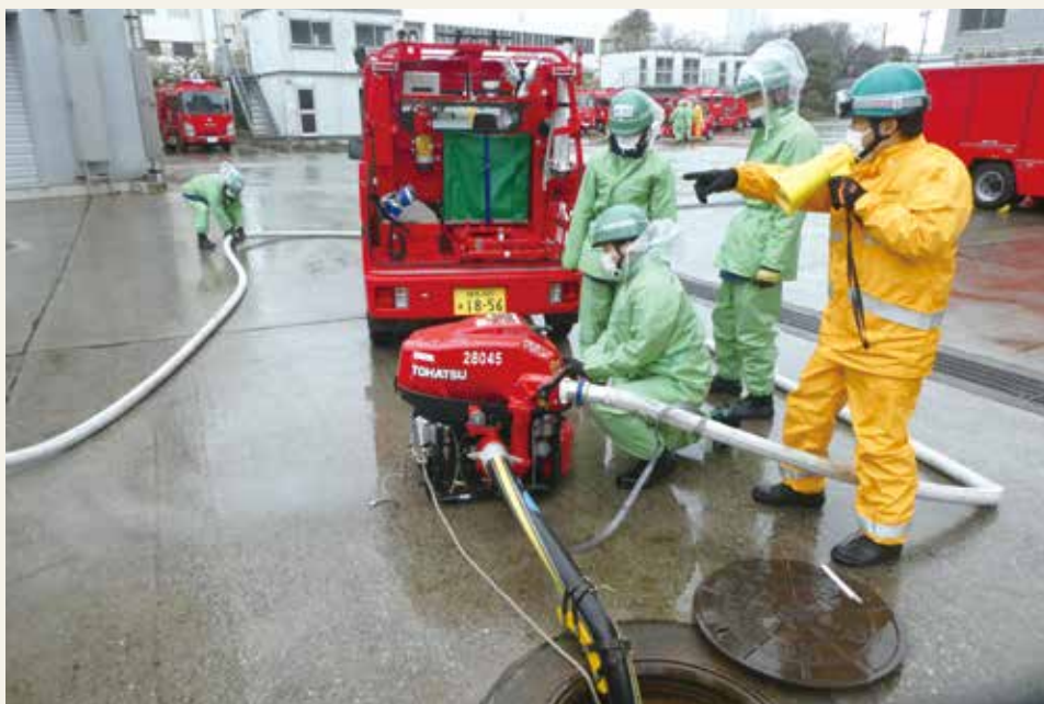
▲ 専科教育 (機関科研修)