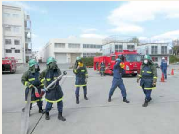
▲ 幹部教育 (初級幹部科研修)