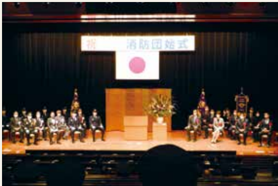
■ 図表3-1-3 特別区消防団の主な行事

新年を迎え、地域の安全を祈願するとともに、地域住民に対して消防団活動への理解を深め、あわせて火災予防意識の向上を目的として実施されるものです。