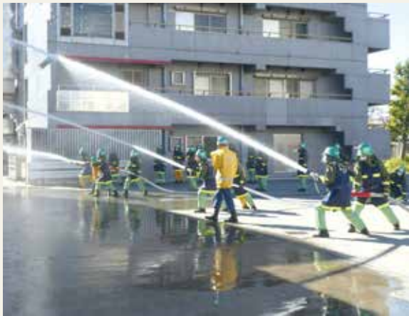
▲ 専科教育 (警防科研修)