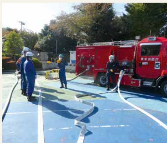
▲ 専科教育(機関科研修)