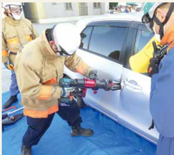
▲ 特別教育 (救助科研修)