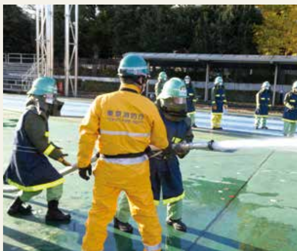
▲ 特別研修(女性消防団員研修)

揮・統率力の向上など、必要な能力の伸長を図ることを目的として実施しています。団長、副団長を対象として管理監督能力の向上を図る上級幹部研修、分団長、副分団長及び部長を対象として大規模災害時