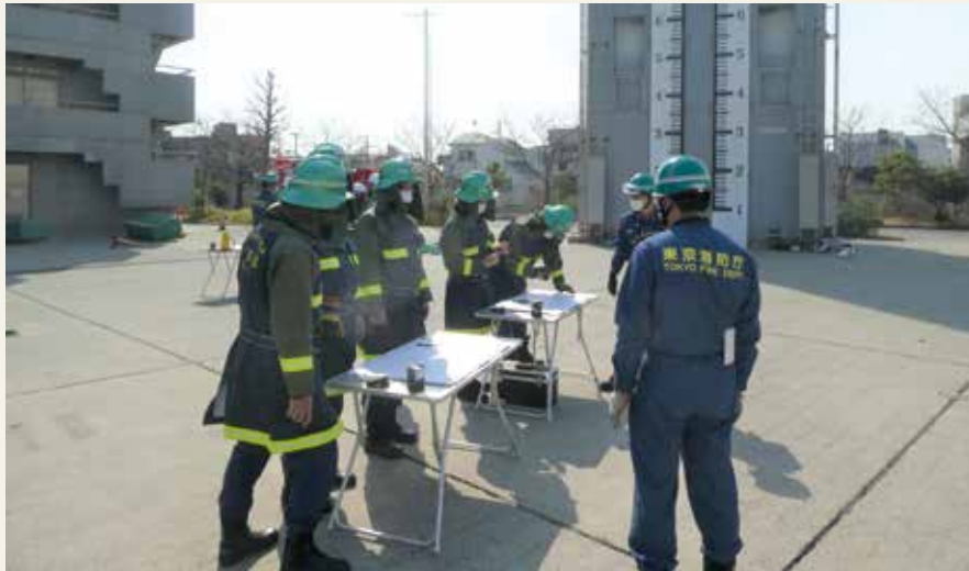
▲ 幹部教育 (指揮幹部科研修)