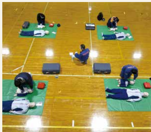
▲ 特別教育 (救急科研修)