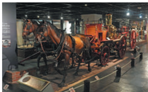
▲馬牽き蒸気ポンプ