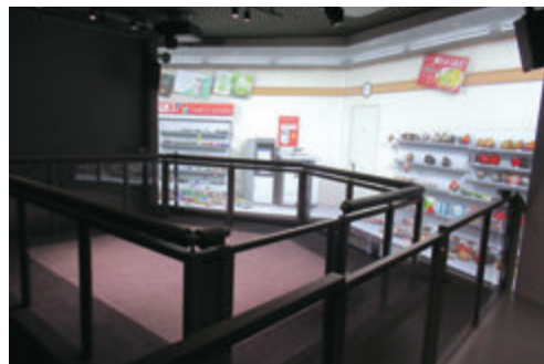
▲ 地震体験コーナー 起震台