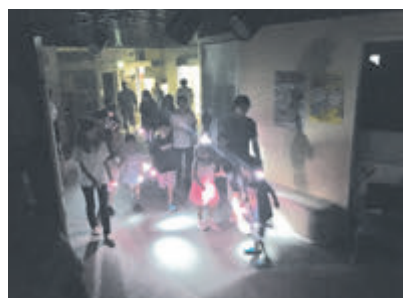
▲ ナイトツアー体験の様子