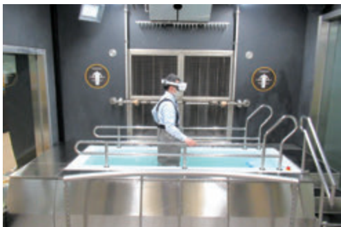
▲ 浸水体験コーナー

地震体験コーナーは、室内だけでなく、屋外やコンビニエンスストア店内での発災を想定した体験ができるほか、ガラススクリーンの活用により体験の待ち時間に地震時の大切なポイントを学ぶことができます。