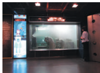
▲ 暴風雨体験コーナー体験の様子

また、画面上部には体験室内の「雨量」「風速」が表示されるため、体験室内の状況がより理解しやすくなっています。