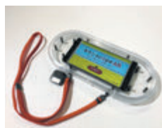
▲ AR タブレット