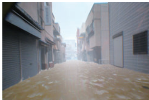
▲ 浸水体験コーナー VRイメージ