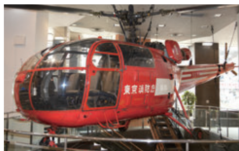
▲消防ヘリコプター