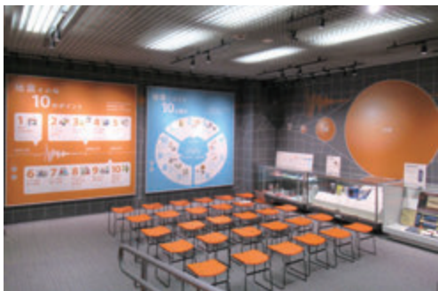
▲ 地震体験コーナー