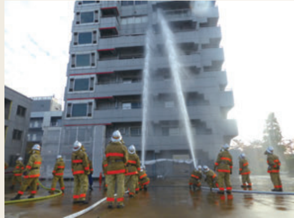
▲ 幹部教育(初級幹部科研修)