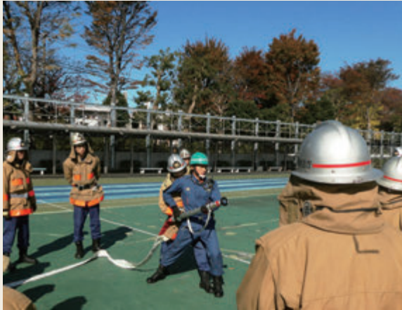
▲ 専科教育(警防科研修)