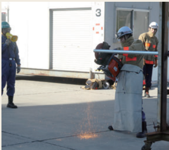
▲ 特別教育(救助科研修)