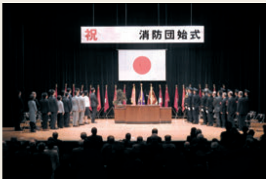
■ 図表3-1-3 特別区消防団の主な行事

新年を迎え、地域の安全を祈願するとともに、地域住民に対して消防団活動への理解を深め、あわせて火災予防意識の向上を目的として実施されるものです。