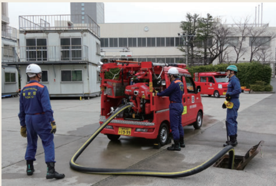
▲ 専科教育(機関科研修)