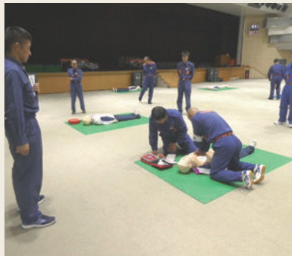
▲ 特別教育(救急科研修)