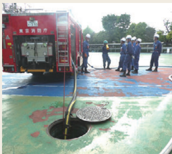
▲ 専科教育(機関科研修)