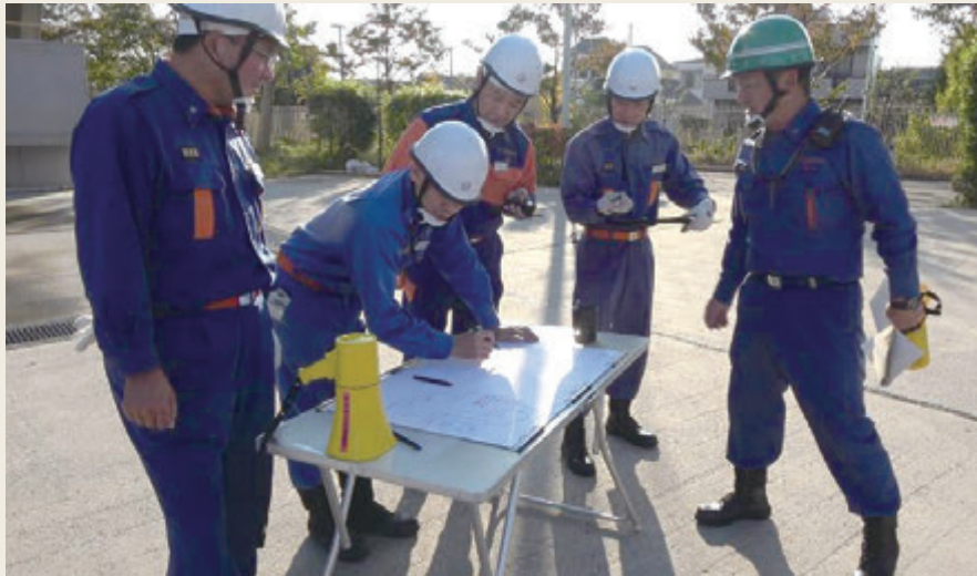
▲ 幹部教育(指揮幹部科研修)