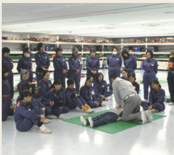
▲ 特別研修(女性消防団員研修)

揮・統率力の向上など、必要な能力の伸長を図ることを目的として実施しています。団長、副団長を対象として管理監督能力の向上を図る上級幹部研修、副団長、分団長、部長を対象として大規模災害時の対応能力