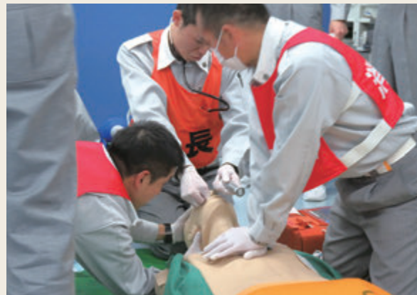
▲ 救急救命士就業前研修