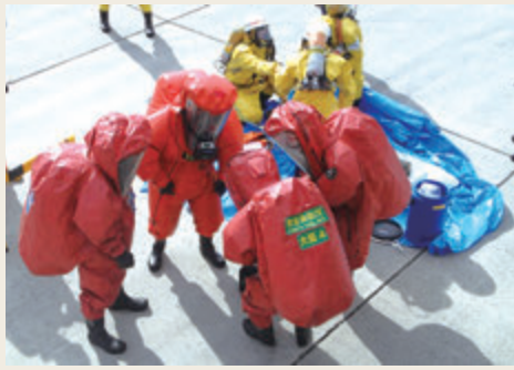
▲ 化学災害技術研修