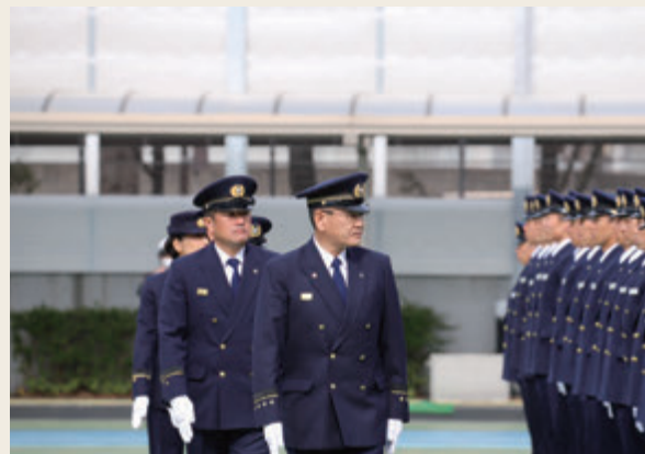
▲ 人員、姿勢、服装等の点検