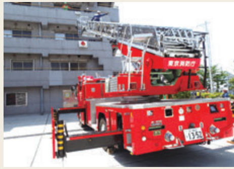
▲ 特別操作機関技術研修