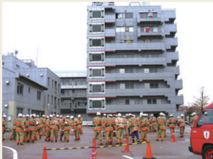
▲ 中級幹部研修(高層ビル火災指揮訓練)

幹部職員としての業務管理能力や消防部隊の指揮・統率力の向上など、その階級職に応じた必要な能力の伸長を図ることを目的として実施しています。(図表2-7-2、3)