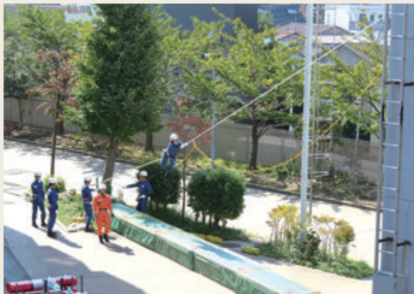
▲ 特別救助技術研修