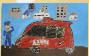
千代田小学校 6年生