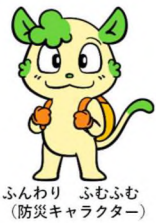
ふんわり ふむふむ (防災キャラクター)

地震による ケガ人の 約3～5割は 家具類の 転倒 落下 移動 による ものだよ！