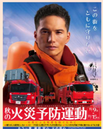
令和4年 秋の火災予防運動ポスター 市原 隼人さん

火災予防運動は、都民の皆様には防火防災に関する意識や防災行動力を高めていただくことにより、火災の発生を防ぎ、万一発生した場合にも被害を最小限にとどめ、火災から尊い命と貴重な財産を守ることを目的としています。