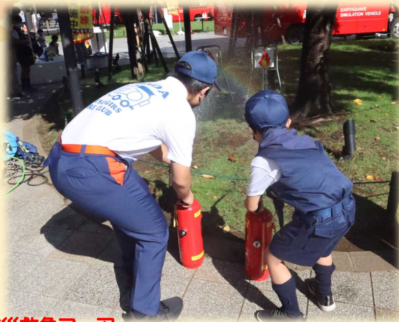
9月4日(日)に行われた防災救急フェア