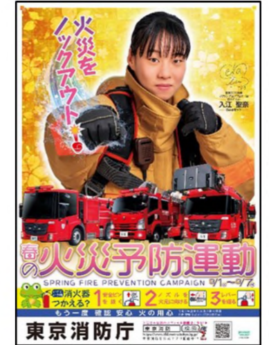
令和4年春の火災予防運動ポスター 〔東京五輪 金メダリスト 入江聖奈さん〕

火災予防運動とは、都民の皆様には防火防災に関する意識や防災行動力を高めていただくことにより、火災の発生を防ぎ、万が一発生した場合にも被害を最小限にとどめ、火災から尊い命と貴重な財産を守ることを目的としています。この機会に、身の回りの火災予防について確認してみましょう。