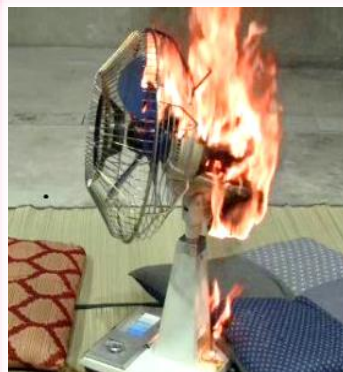
扇風機からの出火