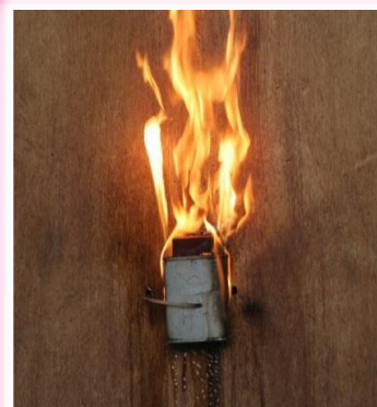
コンデンサからの出火