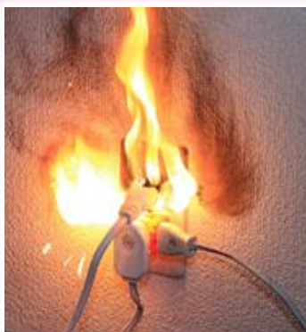
プラグからの出火