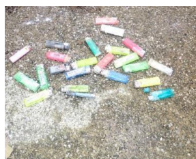
使い捨てライター