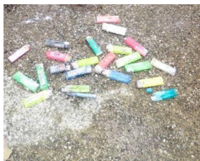
使い捨てライター