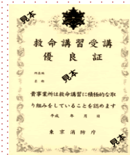
救命講習受講優良証