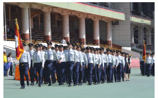
荏原消防団の部隊検閲