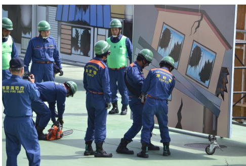
チェーンソー使用による倒壊家屋からの救出訓練

都大会出場の荏原消防団第四分団の消防操法の披露、災害時支援ボランティア、消防少年団も交えて震災等の災害を想定した倒壊家屋からの救助訓練、AED(自動体外式除細動器)を用いた救護訓練など、消防署や地域住民との連携を想定した活