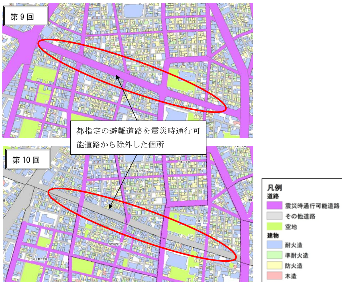
図 4.3 震災時通行可能道路の減少状況（台東区）

今回の調査では、避難者の混雑により消防車両の通行性が妨げられる恐れがある避難道路を、震災時通行可能道路から除外しました。そのため、避難道路が設置されている台東区、大田区、渋谷区、荒川区などで大きく減少しています。(図 4.3)。