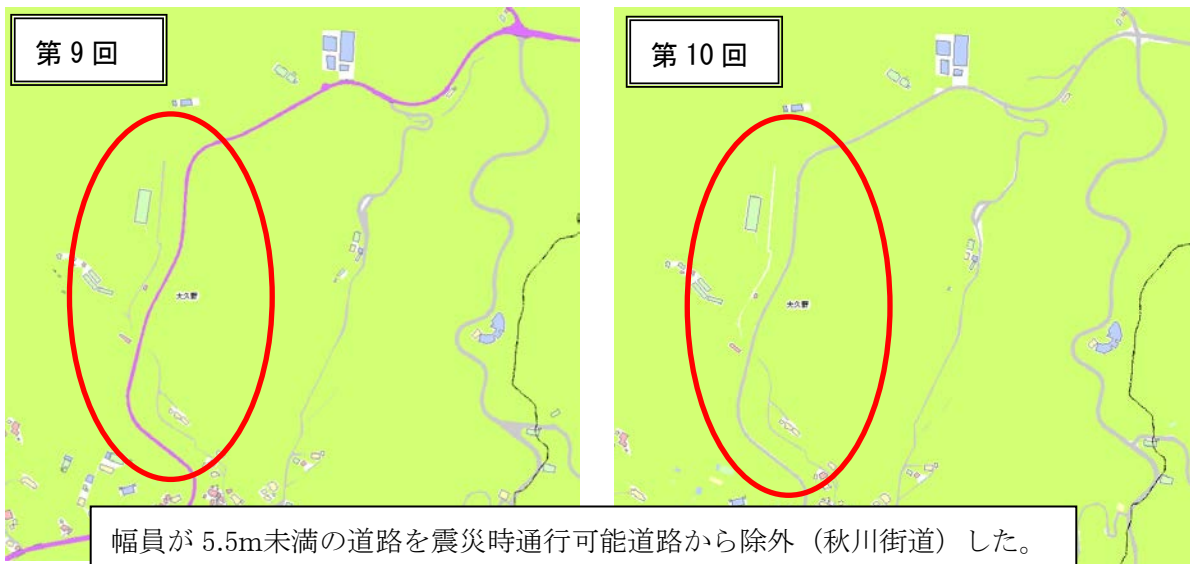
図 4.5 震災時通行可能道路の減少状況（日の出町）

※ 図 4.1～4.5 の道路図画は、国土地理院長の承認（平 24 関公第 269 号）を得て作成した東京都地形図（S=1:2,500）を使用（30 都市基交第 362 号）して作成したものである。無断複製を禁ずる。