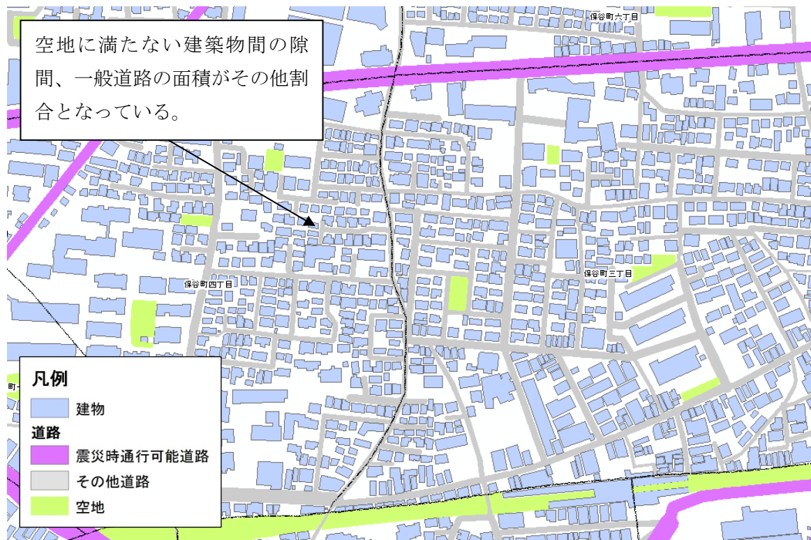
図 4.2 市町村における市街地の特徴（西東京市）

市町村では建築物間の間隙が大きい傾向がみられますが、空地判定の基準に満たないものも多く、このような土地面積がその他面積として抽出されます。一方、市街化の進んだ地域（福生市、西東京市等）では、特別区と同様に一般道路の面積も多く含まれ、高い割合を示しています（図 4.2）。