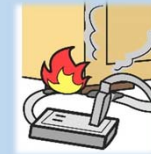
コードが潰されて出火