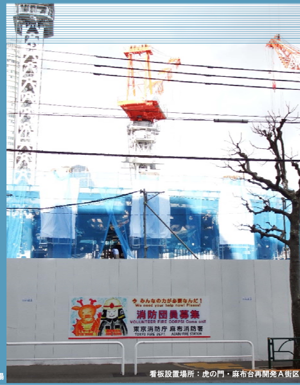
看板設置場所: 虎の門・麻布台再開発A街区