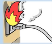
プラグが過熱して出火