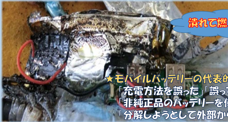
潰れて燃えたバッテリー

★モバイルバッテリーの代表的な火災事例 「充電方法を誤った」「誤って穴を開けた」 「非純正品のバッテリーを使用していた」 「分解しようとして外部から衝撃を与えた」