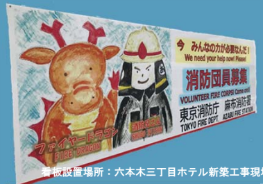
看板設置場所: 六本木三丁目ホテル新築工事現場