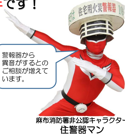
麻布消防署非公認キャラクター 住警器マン