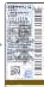
新品用シール (見本)

製品にはリサイクルシールが貼られています。消火器の使用期限が過ぎたら、取り扱い窓口へ引き渡してください。