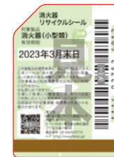
既製品用シール (見本)