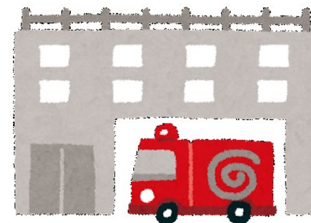
建物を管轄する消防署