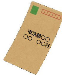
申請書(副)の 返信用の封筒 (切手付)