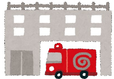
東京消防庁本部庁舎 (予防部予防課火気電気係)