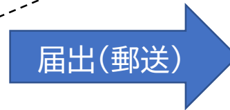
返信用の封筒 （切手付）